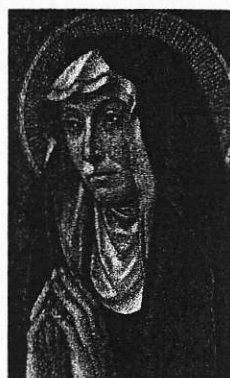
Pomocnica kresťanov, oroduj za nás.